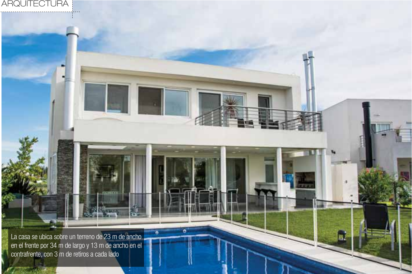
La casa se ubica sobre un terreno de 23 m de ancho en el frente por 34 m de largo y 13 m de ancho en el contrafrente, con 3 m de retiros a cada lado

En la galería de 11m x 3,5m, se incorporó un desnivel para ubicar un hogar a leña, revestido también en piedra, creando un cálido y confortable espacio que invita al relax, con excelentes visuales hacia el jardín y la piscina.