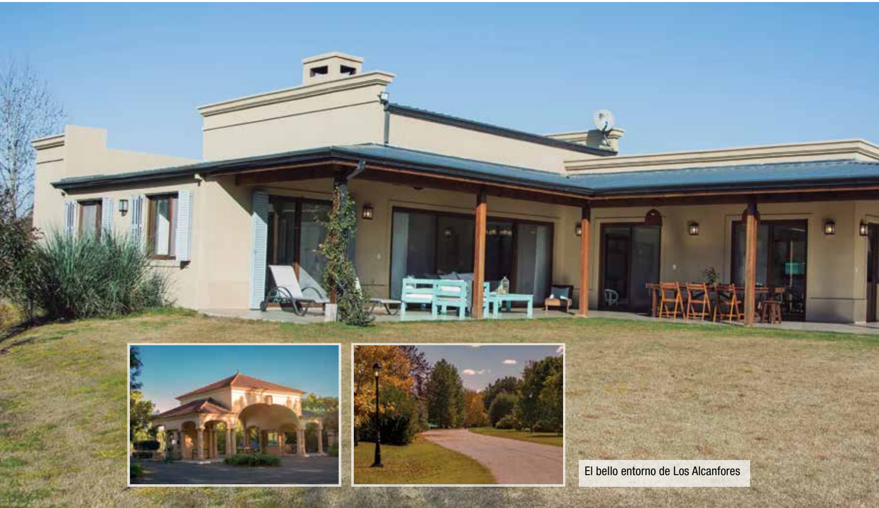
El bello entorno de Los Alcanfores