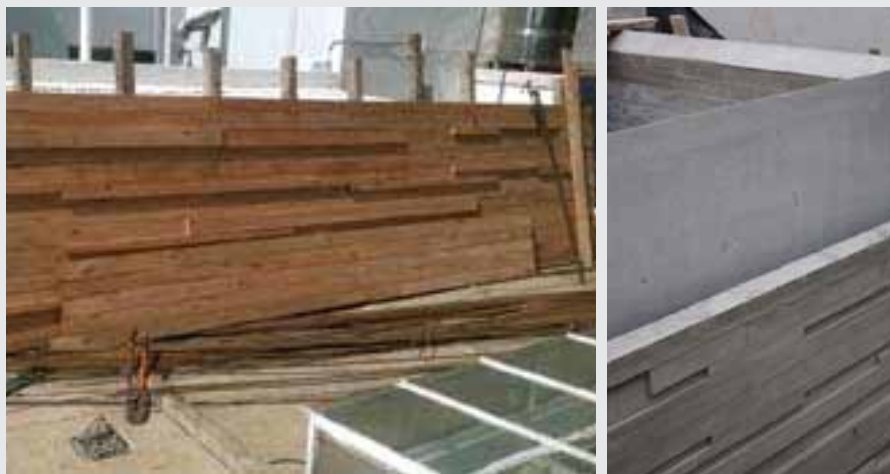
Construir con respeto por el oficio, con conocimiento, con arte, con disfrute por el resultado obtenido. Un diferencial que se evidencia en las obras del estudio Piaggio