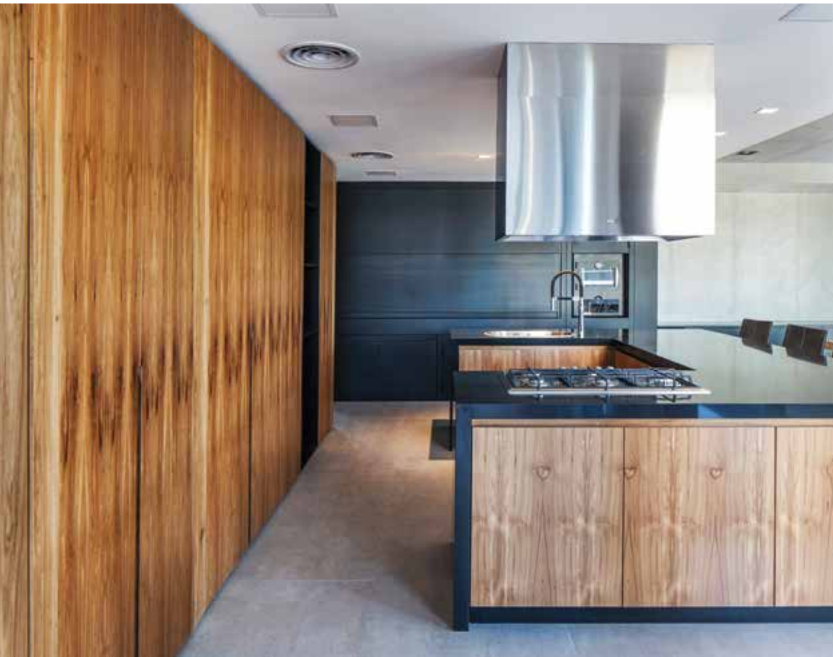
Al fondo, a toda pared, la parrilla de Richard Industrial Work. Un frente de 2.50 m de ancho de boca real, con cajones y puertas. El interior de la campana fue desarrollado para la salida de doble conducto con sombreretes modelo americano