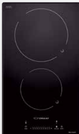
VITRO COOK 2