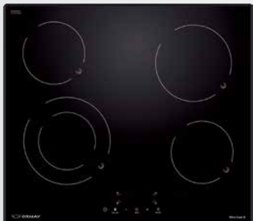
VITRO COOK 4